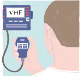
GEBRUIK JE MARIFOON

luister uit en meld je bij bijzondere manoeuvres