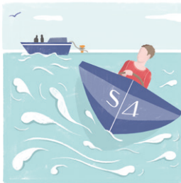
VEROORZAAK GEEN HINDERLIJKE WATERBEWEGING

luister uit en meld je bij bijzondere manoeuvres