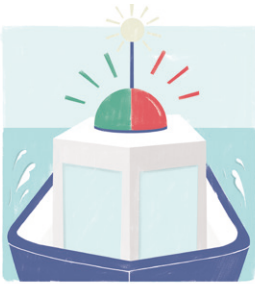
VOER DE JUISTE VERLICHTING

geef beroepsvaart de ruimte, houd rekening met de dode hoek en kijk ook achterom