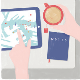
BEREID JE REIS GOED VOOR