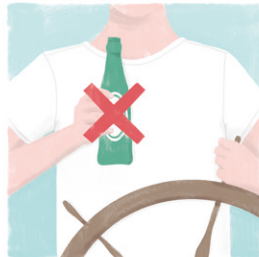
BOB. OOK OP HET WATER