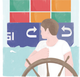
KIJK OM JE HEEN

geef beroepsvaart de ruimte, houd rekening met de dode hoek en kijk ook achterom