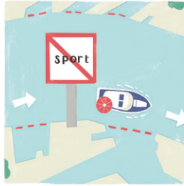
HET IS VERBODEN VOOR PLEZIERVAART HAVEN- BEKKENS IN TE VAREN*